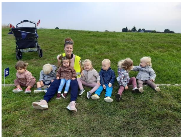
Dybbølsten Royal Run - Vuggestuen

Ved placering af børnene kigger vi altid i samarbejde med forældrene på det enkelte barns udvikling og behov.